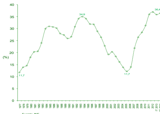
Gráfico 3: Evolución de la ocupación en Andalucía Miles de personas